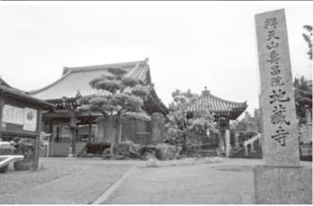
地藏寺(弁天山) 浄土宗本派