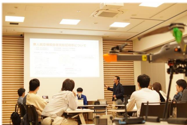
航空法改正・無人航空機操縦者技能証明の セミナー風景