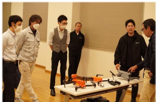
県内初展示となる AUTEK 社「EVO MAX」の説明 (右のグレー色の機体)