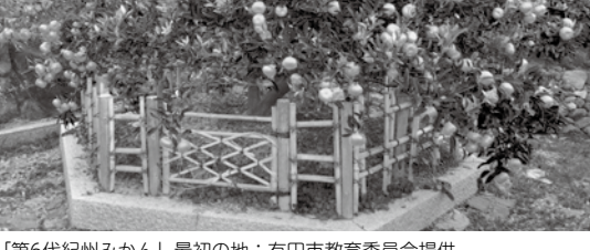
県史跡「第6代紀州みかん」最初の地

きな石碑「紀州蜜柑相祖之碑」も、緒に県の史跡になっています。伊藤家住宅は「主屋・土蔵・納屋(門及び廊下付)」の三棟が、有田市の初め頃の登録有形文化財になりました。建築当初は、主屋と土蔵の間には建物はなく、座敷は明治四十三年に増築されたそうです。主屋は、主屋の建築年代は不明ですが、和釘を使用していることや、小屋組の部材の加工痕から、江戸時代末期の建築であると考